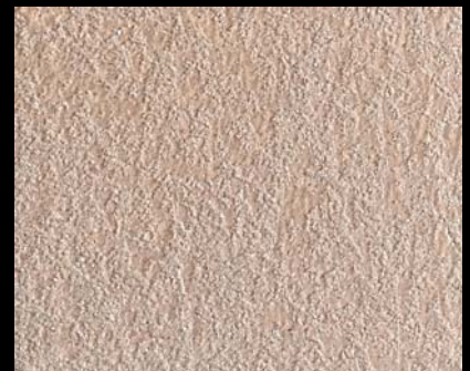
Fondo di Quarzo + Toner № 542 - 4cc