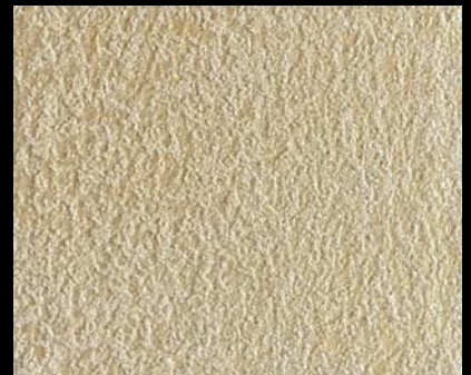
Fondo di Quarzo + Toner № 505 - 6cc