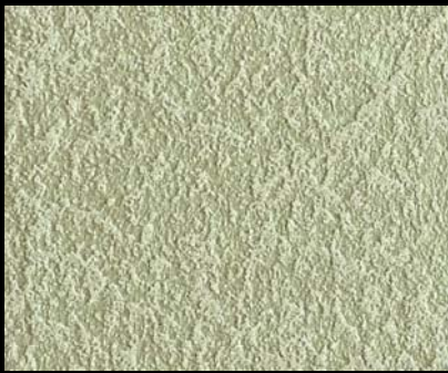
Fondo di Quarzo + Toner № 514 - 3cc