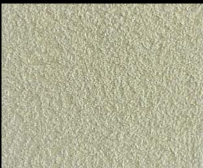
Fondo di Quarzo + Toner № 506 - 1cc