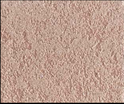
Fondo di Quarzo + Toner № 510 - 1cc