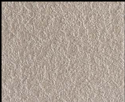
Fondo di Quarzo + Toner № 542 - 1cc