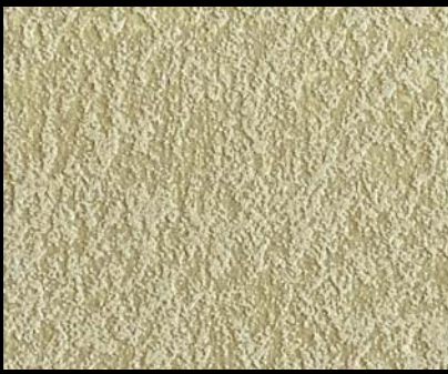
Fondo di Quarzo + Toner № 515 - 2cc