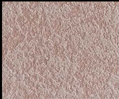
Fondo di Quarzo + Toner № 504 - 3cc