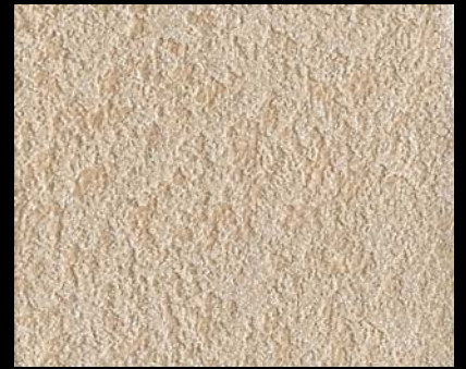
Fondo di Quarzo + Toner № 519 - 4cc