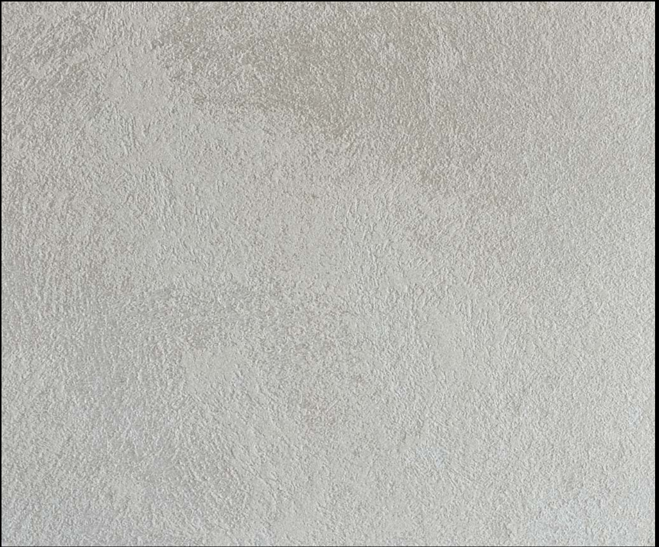
Fondo di Quarzo + Stella