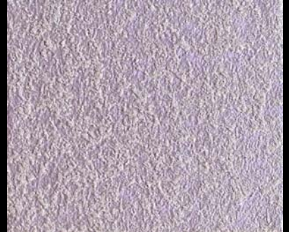
Fondo di Quarzo + Toner № 511 - 6cc