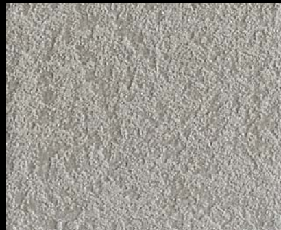
Fondo di Quarzo + Toner № 524 - 2cc