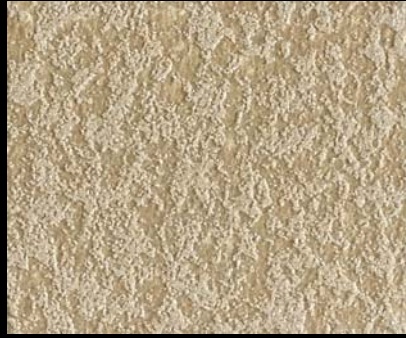
Fondo di Quarzo + Toner № 518 - 2cc