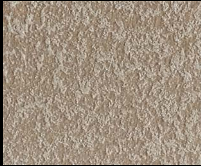
Fondo di Quarzo + Toner № 503 - 3cc