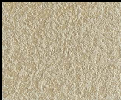
Fondo di Quarzo + Toner № 505 - 3cc