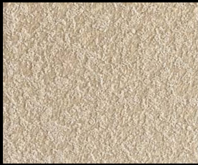
Fondo di Quarzo + Toner № 519 - 2cc