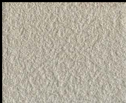
Fondo di Quarzo + Toner № 546 - 2cc