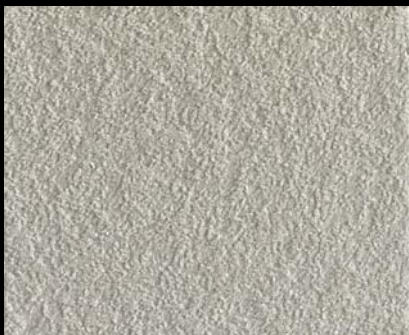
Fondo di Quarzo + Toner № 546 - 1cc