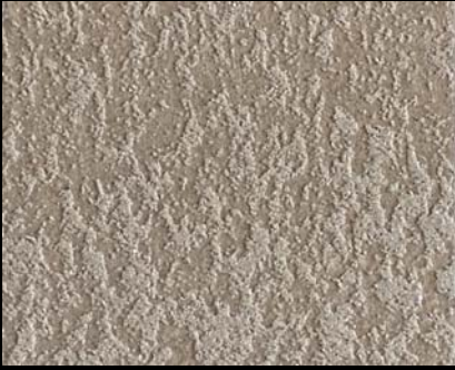
Fondo di Quarzo + Toner № 522 - 1cc