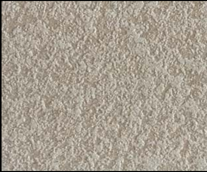
Fondo di Quarzo + Toner № 503 - 1cc