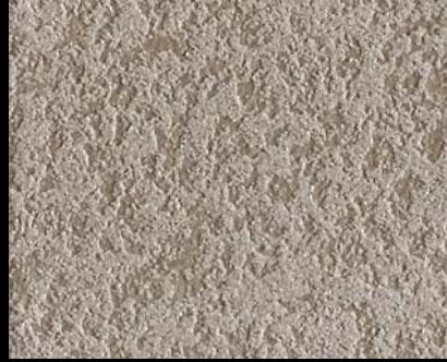
Fondo di Quarzo + Toner № 522 - 2cc