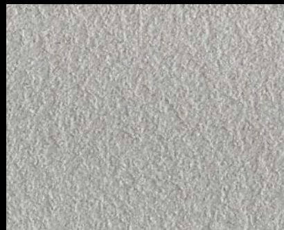
Fondo di Quarzo + Toner № 502 - 3cc