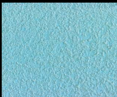
Fondo di Quarzo + Toner № 509 - 3cc