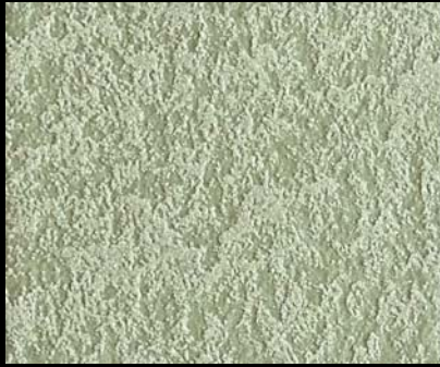
Fondo di Quarzo + Toner № 512 - 3cc