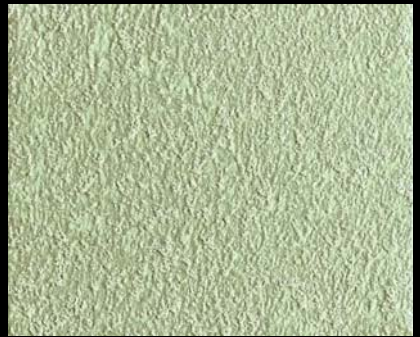
Fondo di Quarzo + Toner № 514 - 6cc