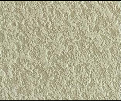
Fondo di Quarzo + Toner № 514 - 1cc