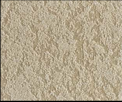
Fondo di Quarzo + Toner № 518 - 1cc