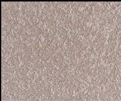
Fondo di Quarzo + Toner № 504 - 1cc