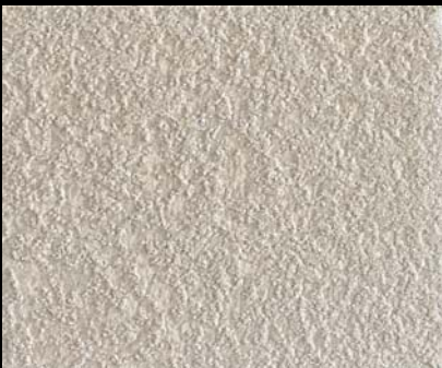
Fondo di Quarzo + Toner № 521 - 1cc