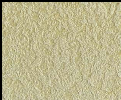
Fondo di Quarzo + Toner № 506 - 3cc