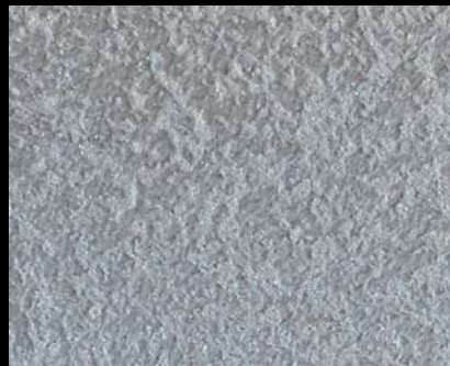
Fondo di Quarzo + Toner № 501 - 3cc