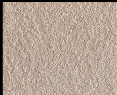
Fondo di Quarzo + Toner № 542 - 2cc