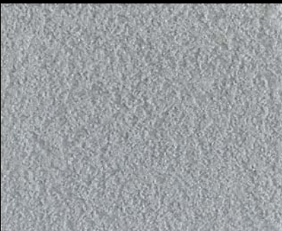
Fondo di Quarzo + Toner № 501 - 1cc