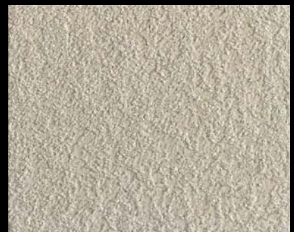
Fondo di Quarzo + Toner № 546 - 4cc