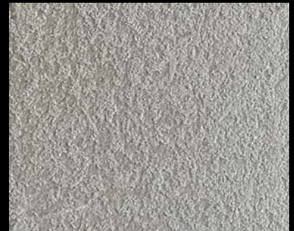
Fondo di Quarzo + Toner № 524 - 4cc