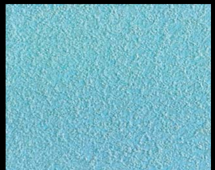
Fondo di Quarzo + Toner № 509 - 6cc