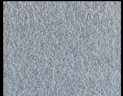
Fondo di Quarzo + Toner № 501 - 6cc