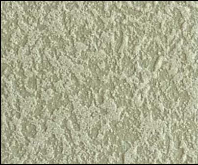
Fondo di Quarzo + Toner № 512 - 1cc