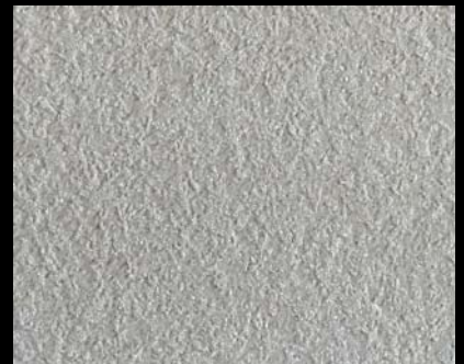
Fondo di Quarzo + Toner № 502 - 6cc