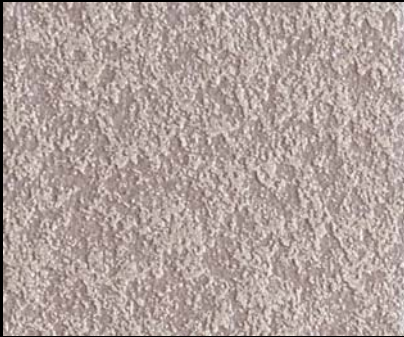
Fondo di Quarzo + Toner № 511 - 1cc