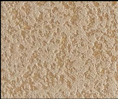
Fondo di Quarzo + Toner № 518 - 8cc