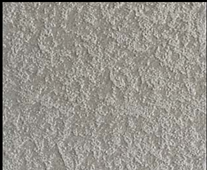
Fondo di Quarzo + Toner № 524 - 1cc