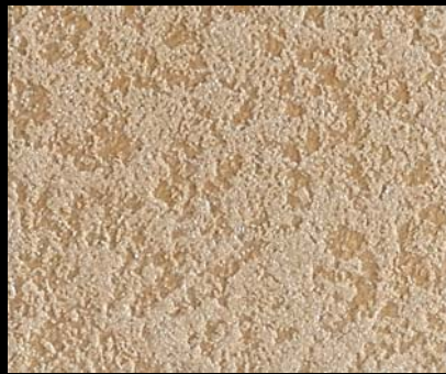
Fondo di Quarzo + Toner № 518 - 10cc