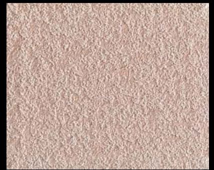
Fondo di Quarzo + Toner № 520 - 4cc