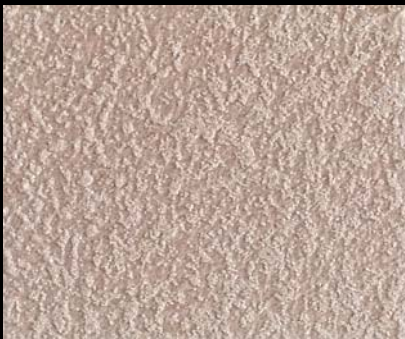
Fondo di Quarzo + Toner № 520 - 1cc