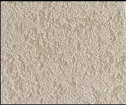
Fondo di Quarzo + Toner № 519 - 1cc