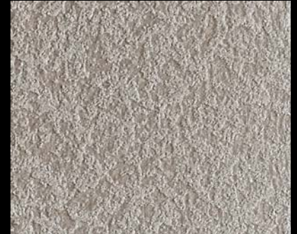
Fondo di Quarzo + Toner № 523 - 4cc