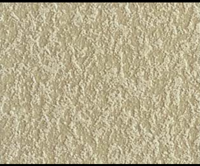
Fondo di Quarzo + Toner № 515 - 1cc