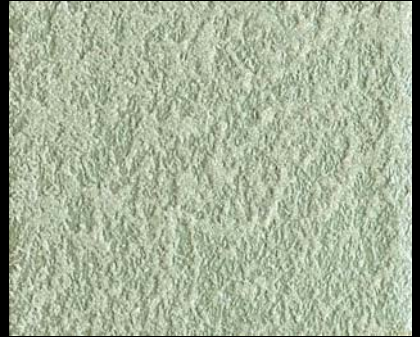
Fondo di Quarzo + Toner № 512 - 6cc