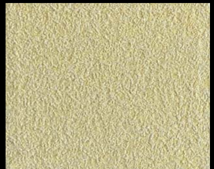
Fondo di Quarzo + Toner № 506 - 6cc