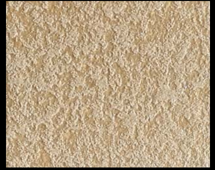
Fondo di Quarzo + Toner № 518 - 4cc