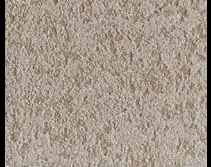
Fondo di Quarzo + Toner № 503 - 6cc