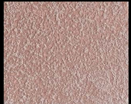
Fondo di Quarzo + Toner № 504 - 6cc