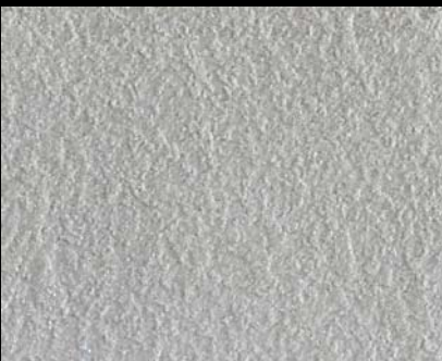
Fondo di Quarzo + Toner № 502 - 1cc