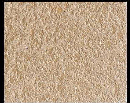
Fondo di Quarzo + Toner № 518 - 12cc