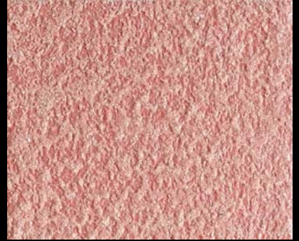
Fondo di Quarzo + Toner № 510 - 6cc