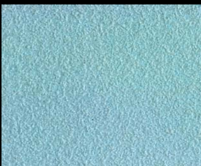
Fondo di Quarzo + Toner № 509 - 1cc