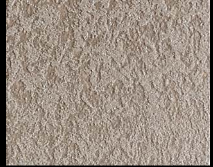
Fondo di Quarzo + Toner № 522 - 4cc