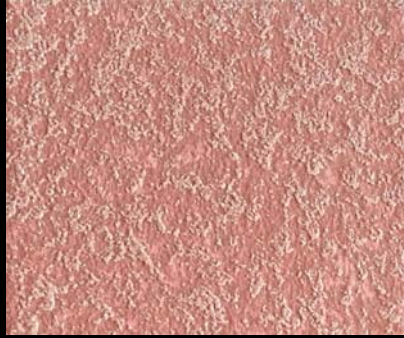
Fondo di Quarzo + Toner № 510 - 3cc