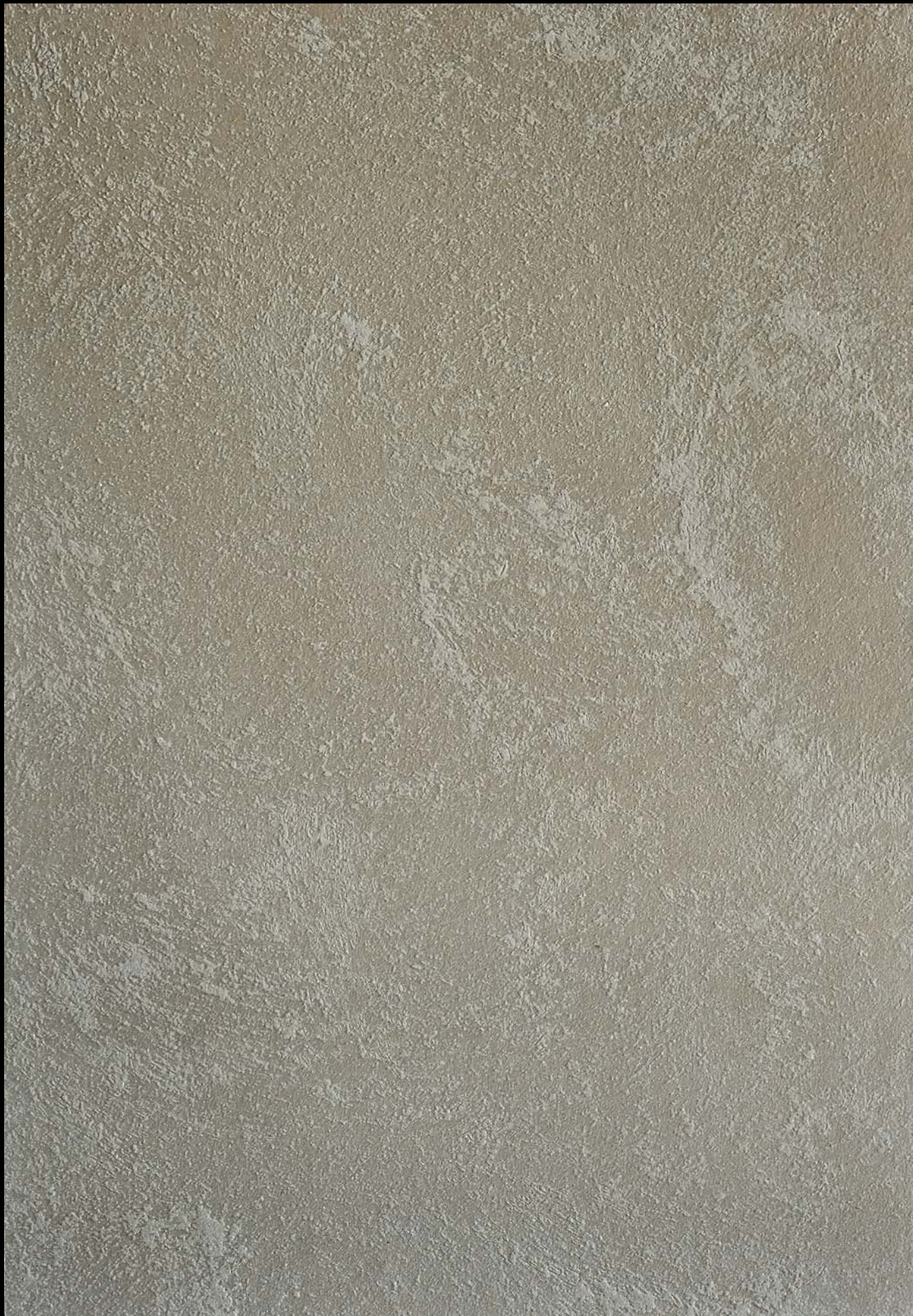
Fondo di Quarzo + Toner №503-4cc + № 502 - 4cc