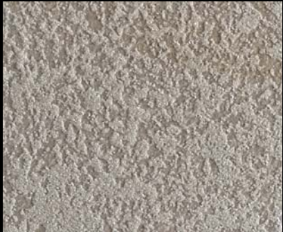
Fondo di Quarzo + Toner № 523 - 1cc