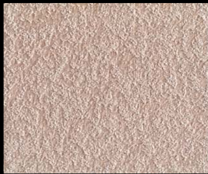
Fondo di Quarzo + Toner № 520 - 2cc