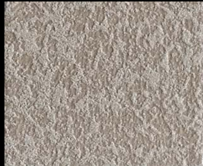
Fondo di Quarzo + Toner № 523 - 2cc