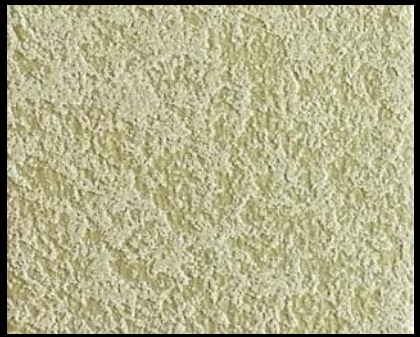
Fondo di Quarzo + Toner № 515 - 4cc