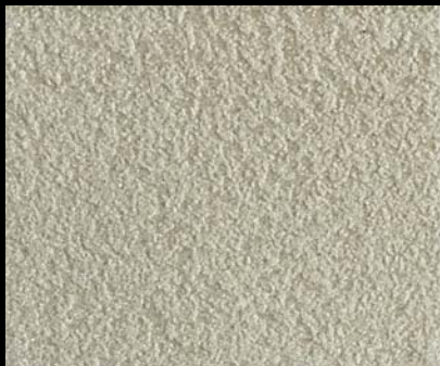
Fondo di Quarzo + Toner № 505 - 1cc