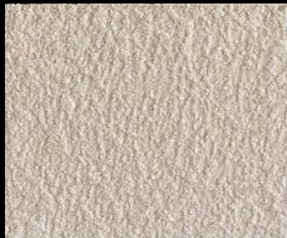
Fondo di Quarzo + Toner № 521 - 2cc