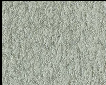
Toner № 502 - 2cc