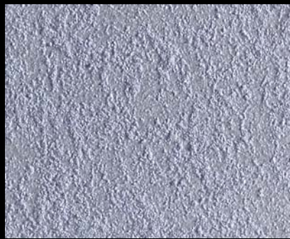
Toner № 511 - 2cc