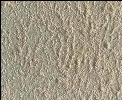
Toner № 519 - 1cc