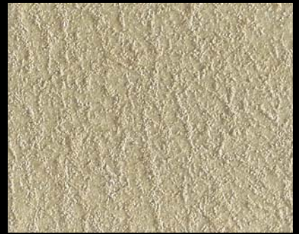
Toner № 546 6cc