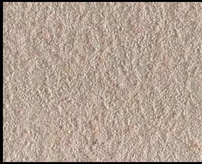
Toner № 542- 2cc