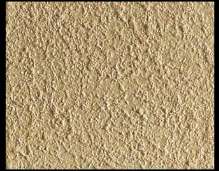
Toner № 518 - 6cc