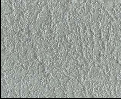
Toner № 523 - 1cc