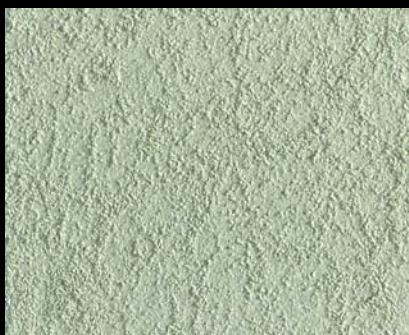
Toner № 515 - 2cc