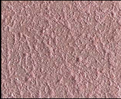
Toner № 510 - 1cc