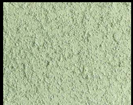
Toner № 515 - 6cc