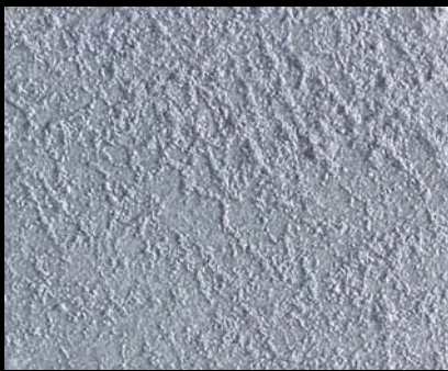
Toner № 511 - 1cc