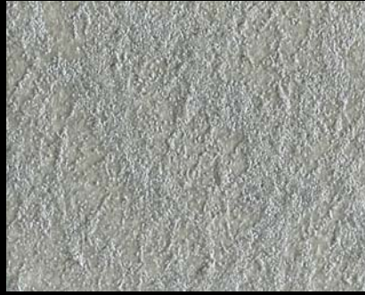
Toner № 523 - 2cc