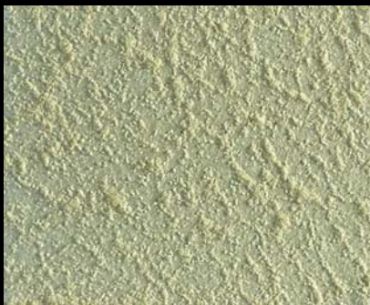
Toner № 506 - 1cc