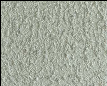
Toner № 502 - 1cc