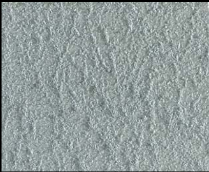
Toner № 524 - 1cc