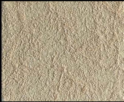
Toner № 519 - 2cc