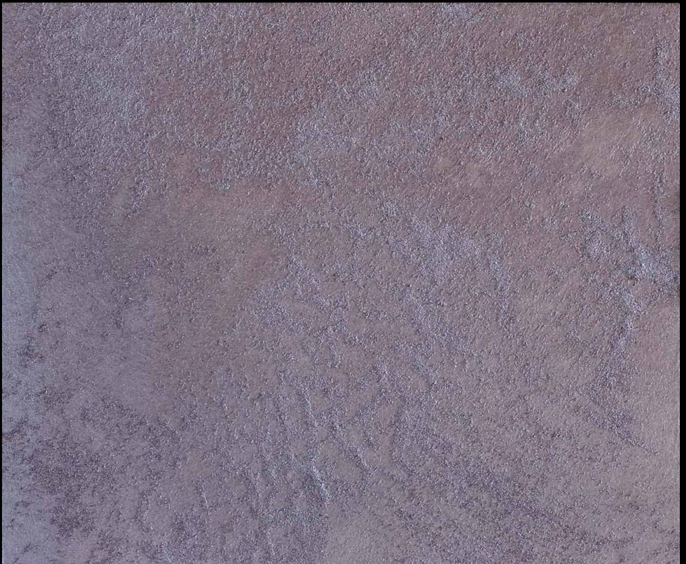
Sabbia Perlata +Toner № 512 - 8cc+ Toner № 510 — 8cc