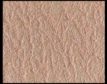
Toner № 542- 6cc