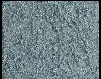
Toner № 501 - 6cc