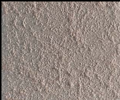
Toner № 504 - 1cc