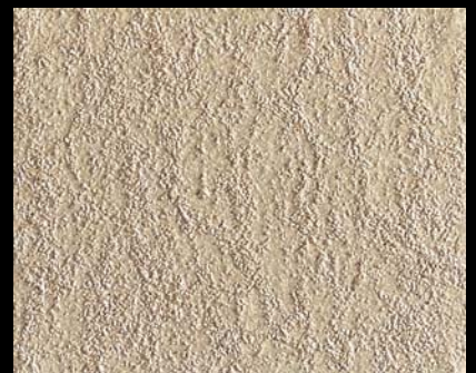
Toner № 521 - 6cc