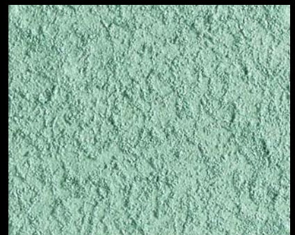
Toner № 512 - 6cc