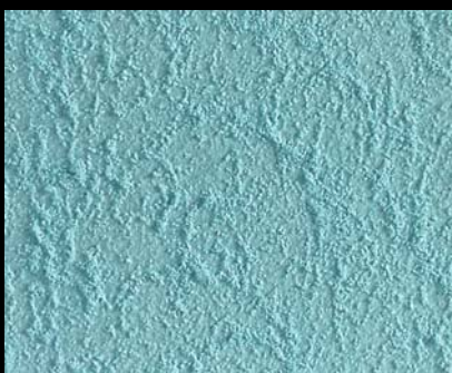
Toner № 509 - 1cc