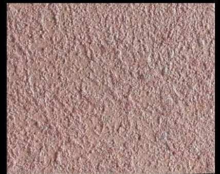
Toner № 504 - 6cc