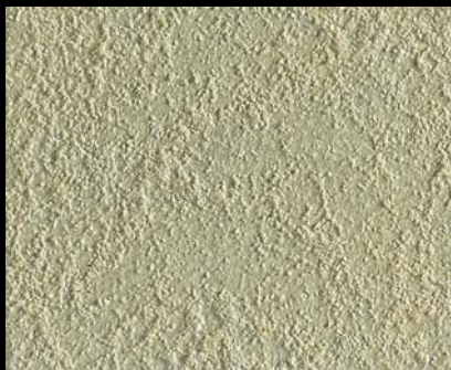
Toner № 505 - 2cc