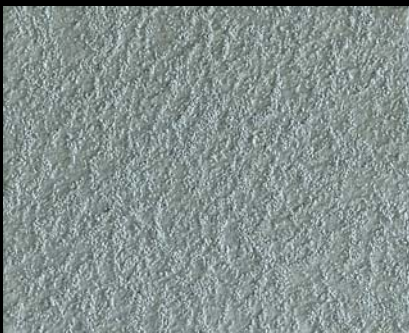
Toner № 501 - 1cc