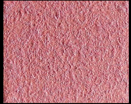
Toner № 510 - 6cc