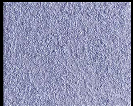
Toner № 511 - 6cc