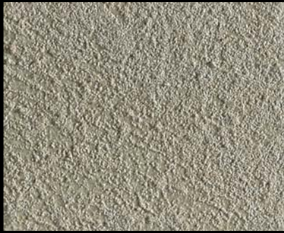
Toner № 503 - 2cc