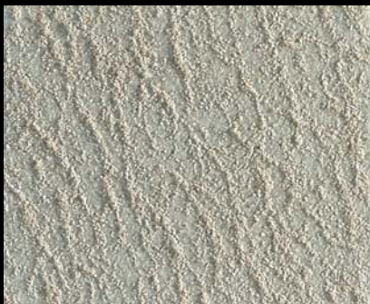
Toner № 521 - 1cc