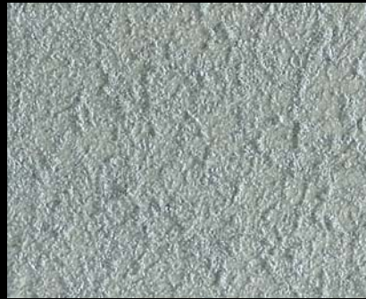
Toner № 524 - 2cc