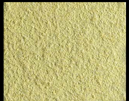
Toner № 506 - 6cc