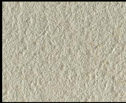
Toner № 546- 2cc