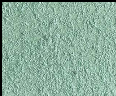
Toner № 512 - 2cc