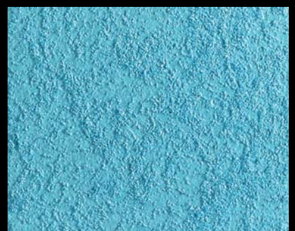
Toner № 509 - 6cc