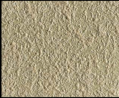
Toner № 518 - 2cc