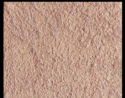
Toner № 520 - 6cc