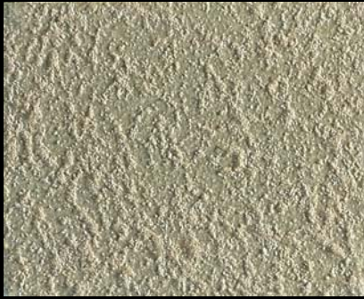
Toner № 518 - 1cc