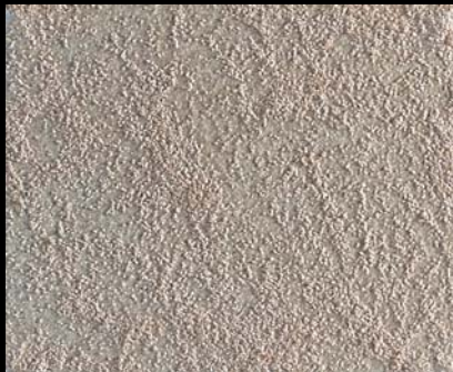
Toner № 520 - 1cc