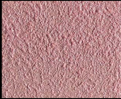
Toner № 510 - 2cc