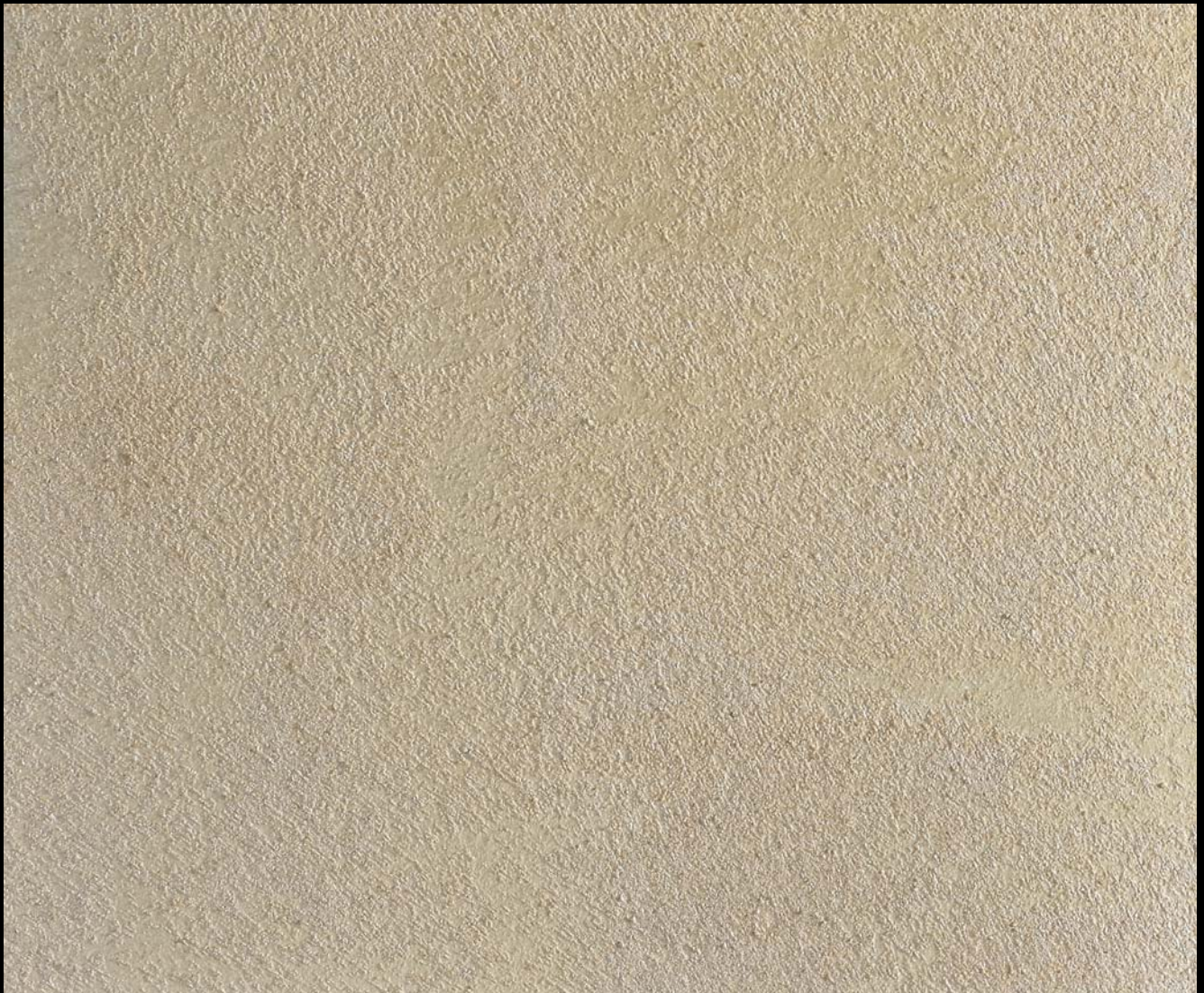
Sabbia Perlata +Toner № 505 - 2cc+ Toner № 519 — 2cc