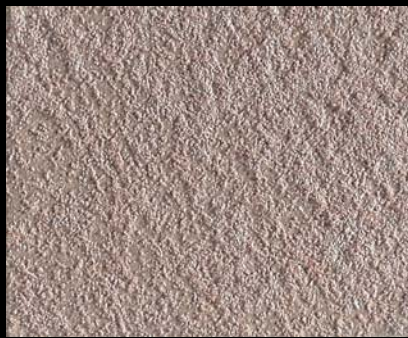
Toner № 504 - 2cc