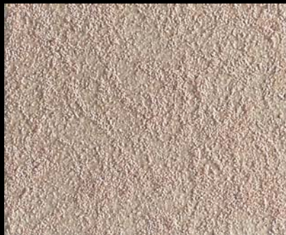
Toner № 520 - 2cc