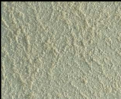
Toner № 505 - 1cc