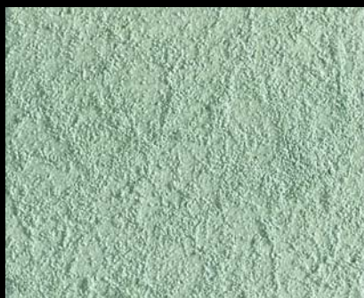
Toner № 514 - 2cc