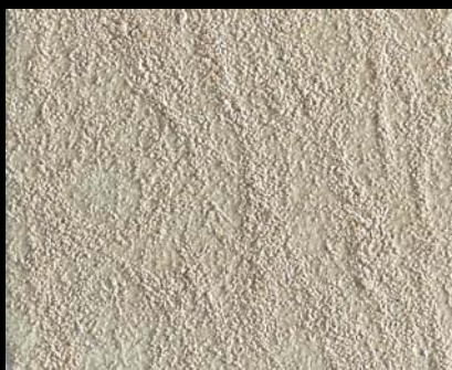
Toner № 521 - 2cc