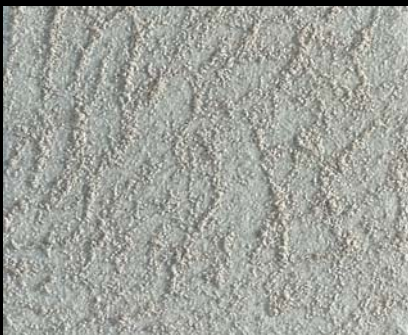
Toner № 522 - 1cc