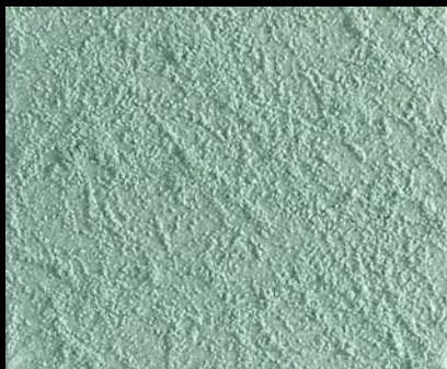
Toner № 512 - 1cc