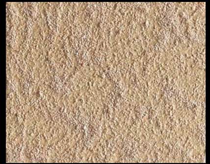
Toner № 519 - 6cc