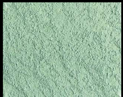
Toner № 514 - 6cc