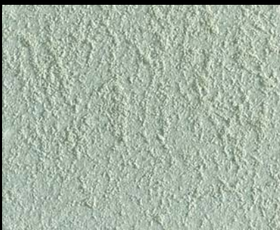
Toner № 515 - 1cc