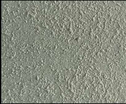
Toner № 503 - 1cc