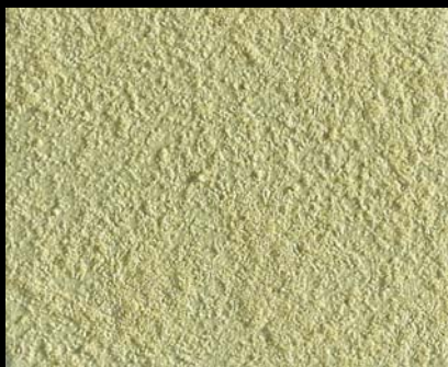
Toner № 506 - 2cc