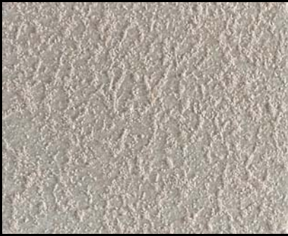
Toner № 542- 1cc