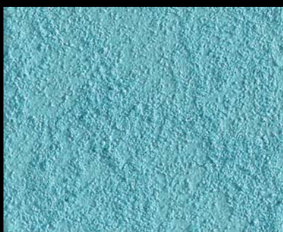
Toner № 509 - 2cc