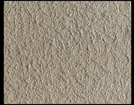
Toner № 503 - 6cc