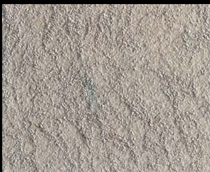
Toner № 522 - 2cc