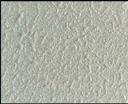
Toner № 546- 1cc