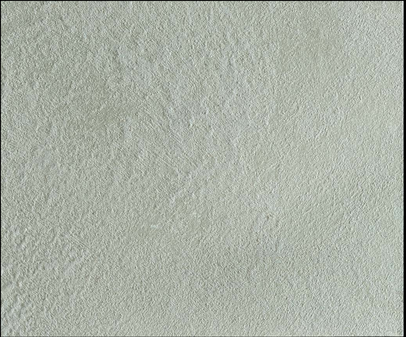
Sabbia Perlata Silver