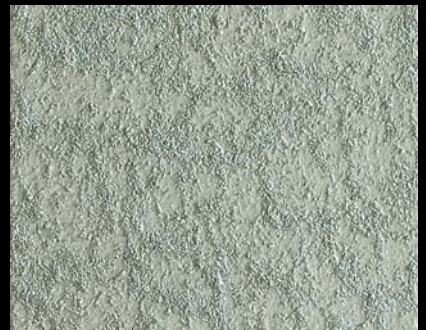
Toner № 502 - 6cc