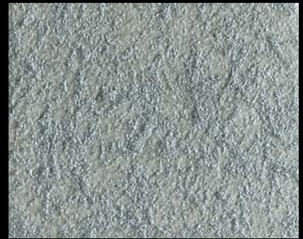
Toner № 524 - 6cc