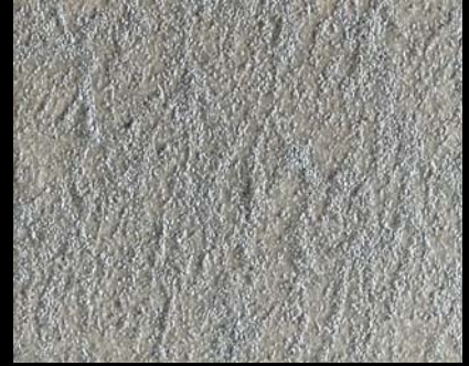
Toner № 523 - 6cc