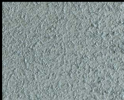
Toner № 501 - 2cc