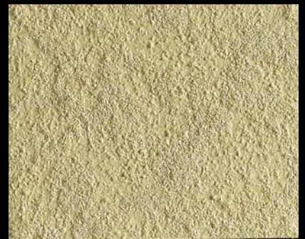
Toner № 505 - 6cc