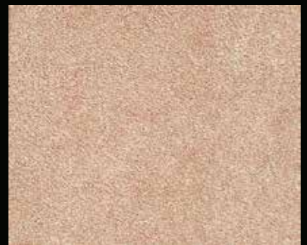
Toner № 518 - 6cc