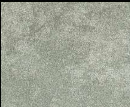
Toner № 502 - 1cc