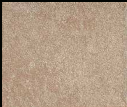
Toner № 503 - 2cc