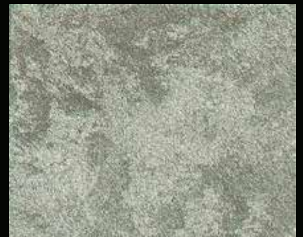
Toner № 502 - 6cc