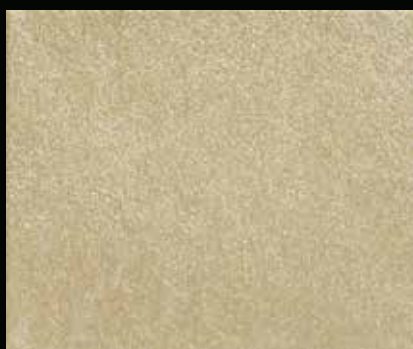
Toner № 546 - 2cc