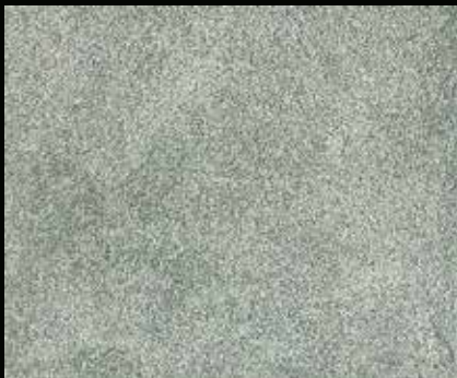
Toner № 501 - 1cc