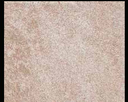
Toner № 522 - 6cc