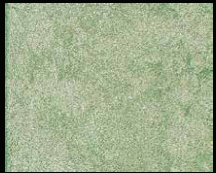
Toner № 514 - 6cc