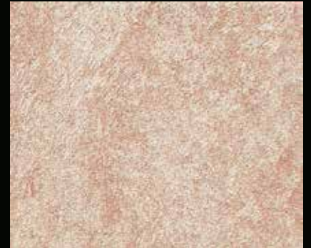
Toner № 521 - 6cc