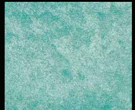
Toner № 509 - 6cc