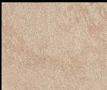
Toner № 519 - 2cc