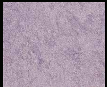
Toner № 511 - 6cc