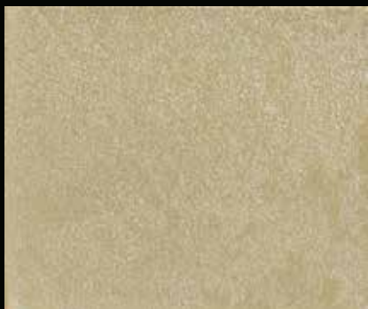
Toner № 546 - 1cc