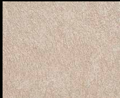
Toner № 522 - 2cc