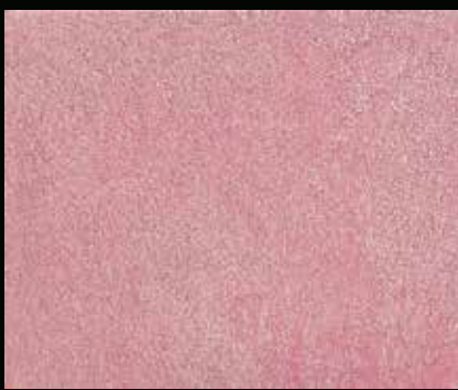
Toner № 510 - 1cc