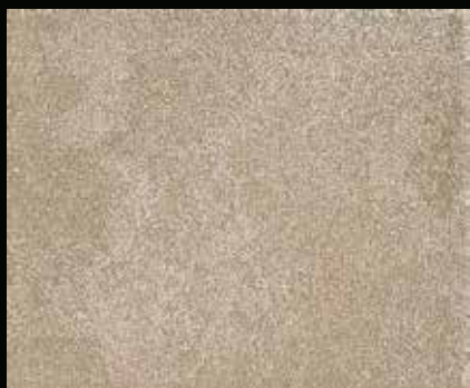
Toner № 503 - 1cc