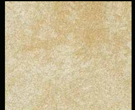
Toner № 506 - 6cc