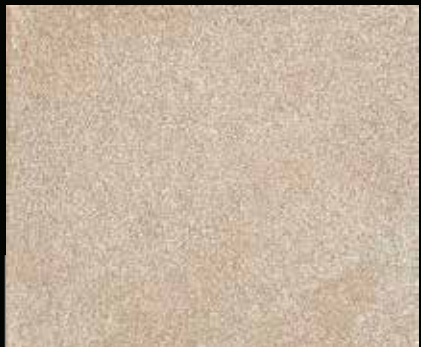
Toner № 522 - 1cc