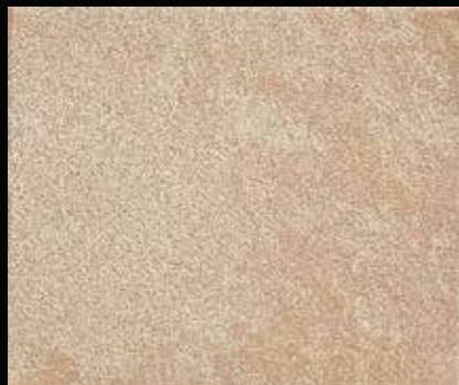
Toner № 518 - 2cc