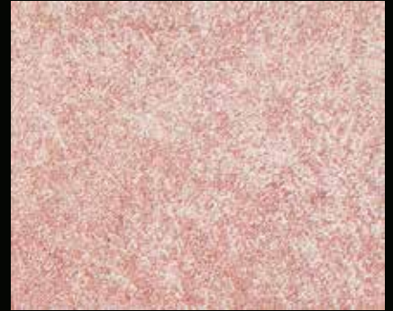
Toner № 520 - 6cc