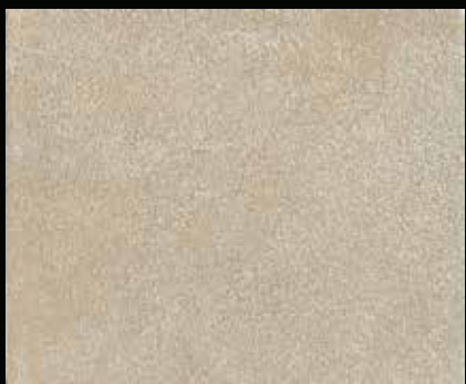
Toner № 524 - 1cc