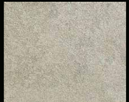
Toner № 524 - 6cc