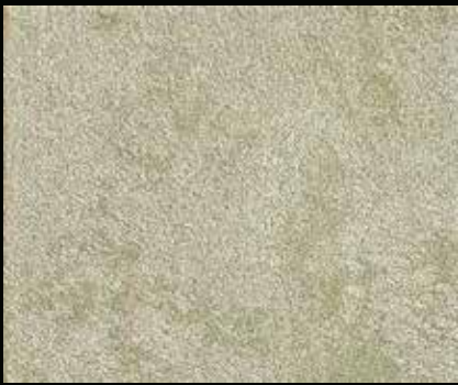
Toner № 514 - 1cc