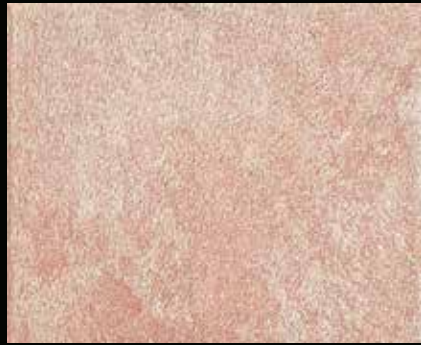
Toner № 520 - 2cc