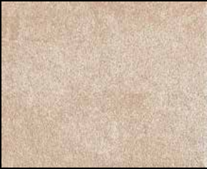
Toner № 520 - 1cc