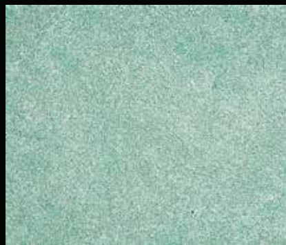
Toner № 509 - 2cc