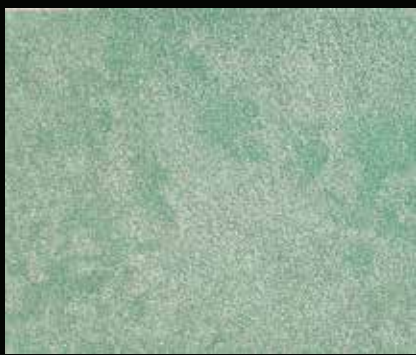
Toner № 509 - 1cc