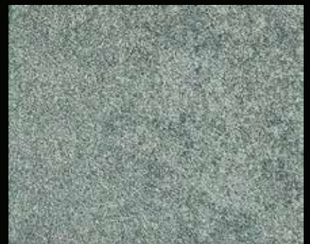
Toner № 501 - 6cc