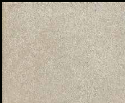
Toner № 524 - 2cc