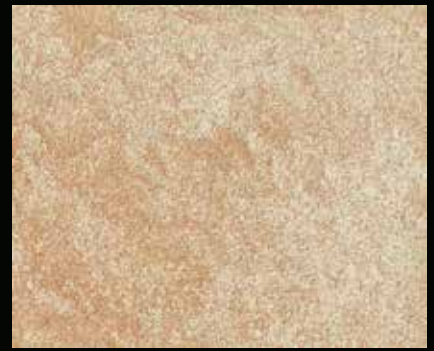
Toner № 505 - 6cc