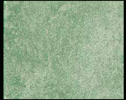
Toner № 512 - 6cc