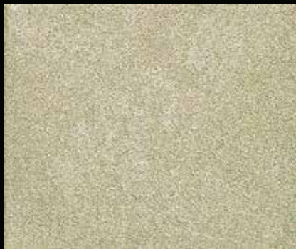
Toner № 515 - 2cc