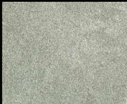
Toner № 502 - 2cc