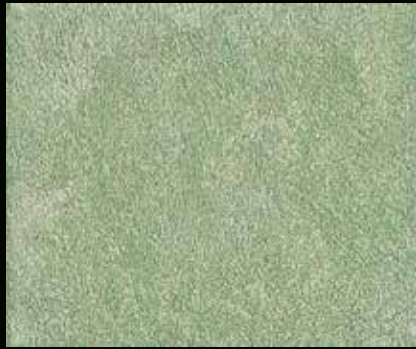
Toner № 512 - 2cc