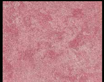
Toner № 504 - 6cc