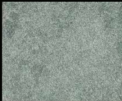
Toner № 501 - 2cc