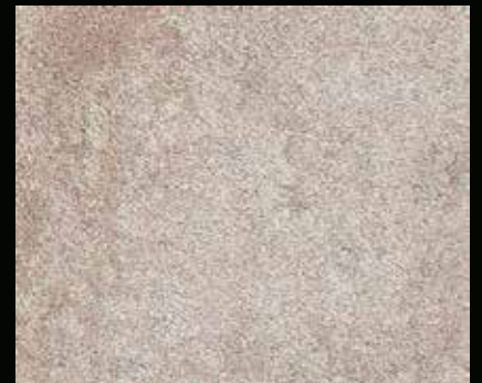
Toner № 523 - 6cc