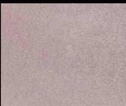
Toner № 511 - 1cc