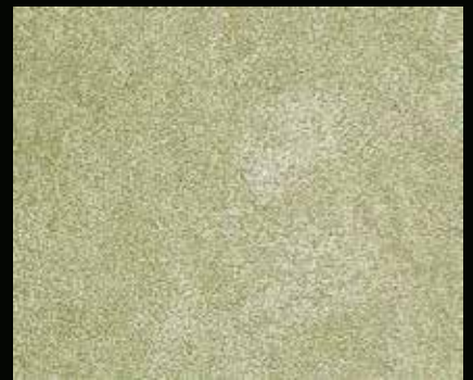
Toner № 515 - 6cc