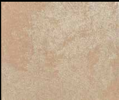
Toner № 542 - 1cc