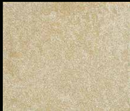
Toner № 506 - 2cc