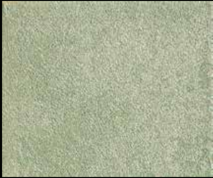
Toner № 512 - 1cc