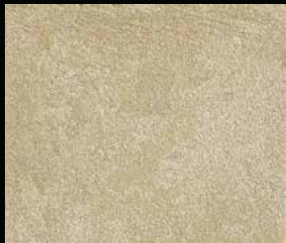
Toner № 506 - 1cc