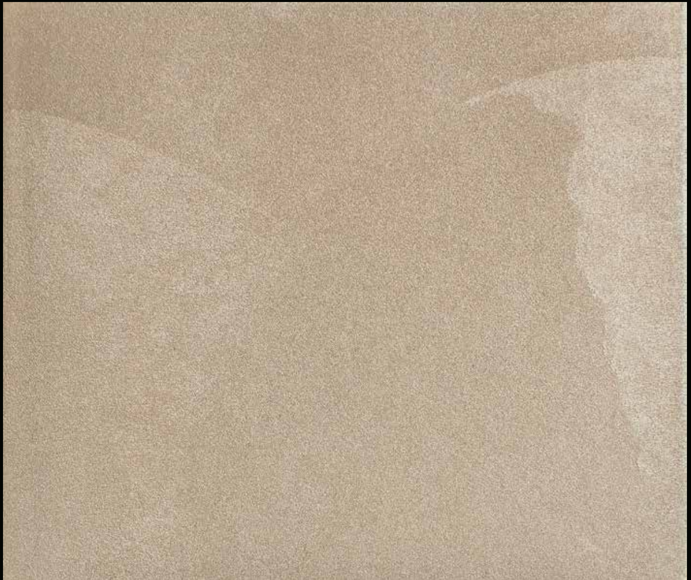
La Perla + Toner № 503 - 0,5cc