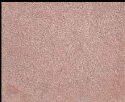
Toner № 504 - 1cc