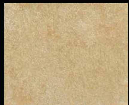
Toner № 546 - 6cc