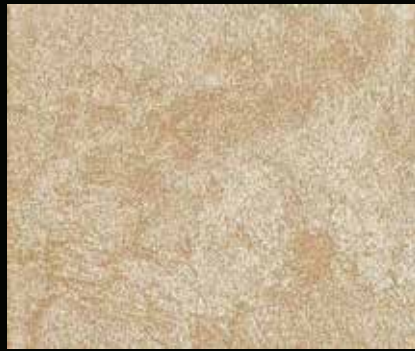
Toner № 505 - 2cc