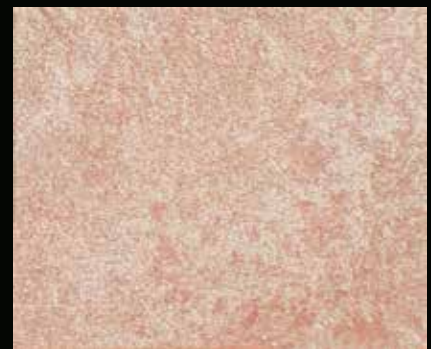
Toner № 542 - 6cc