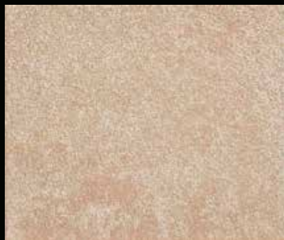
Toner № 542 - 2cc