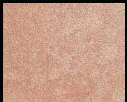
Toner № 519 - 6cc