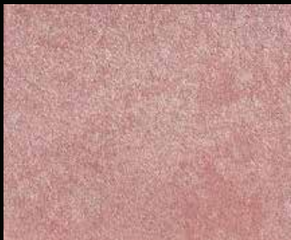
Toner № 504 - 2cc