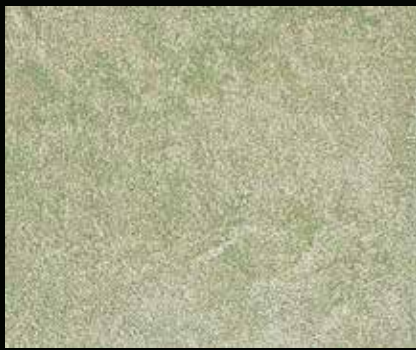
Toner № 514 - 2cc