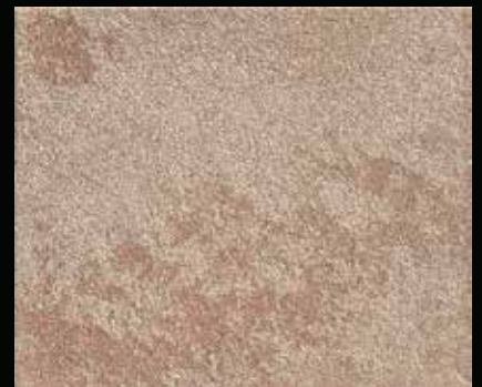
Toner № 503 - 6cc