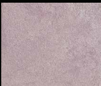
Toner № 511 - 2cc