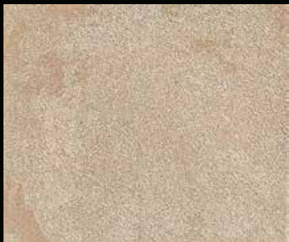
Toner № 518 - 1cc