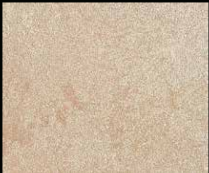
Toner № 521 - 1cc