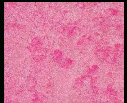
Toner № 510 - 6cc