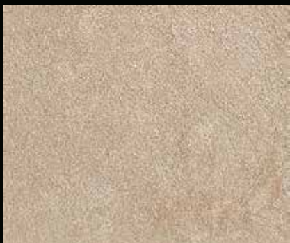
Toner № 519 - 1cc