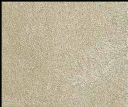
Toner № 515 - 1cc