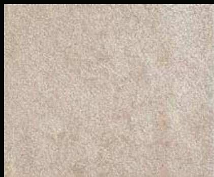
Toner № 523 - 2cc