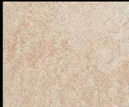
Toner № 521 - 2cc