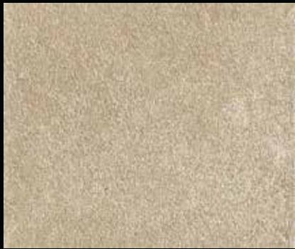
Toner № 505 - 1cc