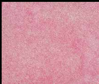
Toner № 510 - 2cc