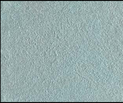
Toner № 509 - 0,5cc