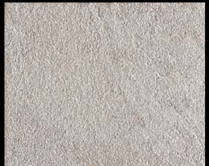
Toner № 523 - 4cc