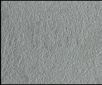
Toner № 501 - 0,5cc