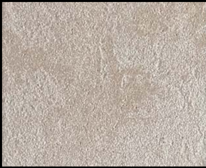
Toner № 522 - 1cc