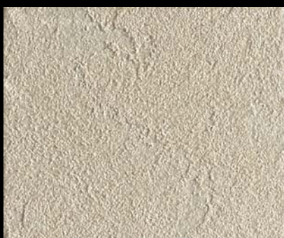
Toner № 518 - 1cc