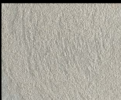
Toner № 519 - 0,5cc