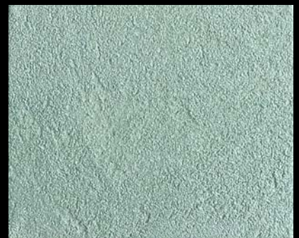
Toner № 512 - 4cc