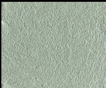
Toner № 514 - 1cc