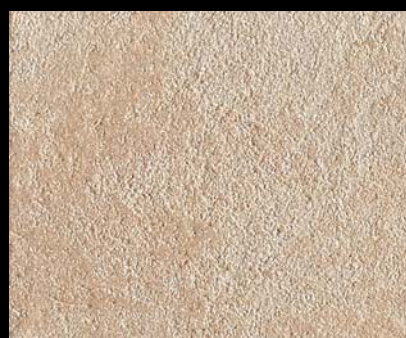
Toner № 519 - 4cc