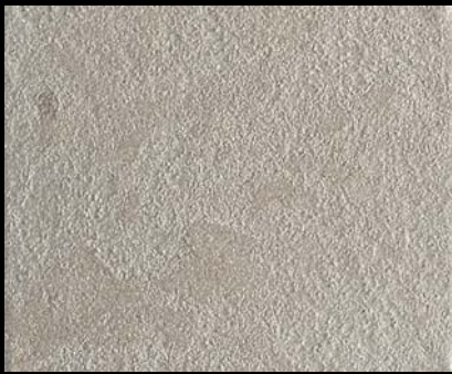
Toner № 503 - 0,5cc