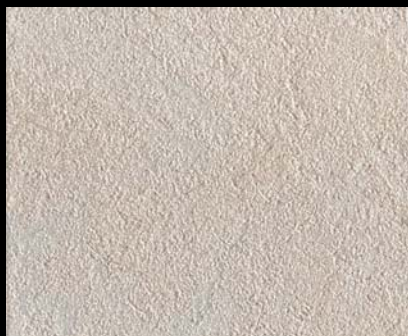
Toner № 542 - 1cc