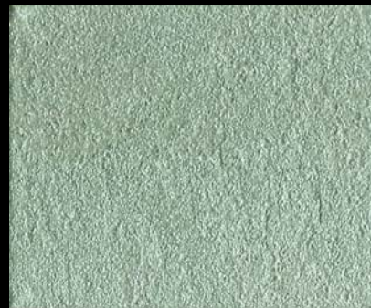
Toner № 514 - 4cc