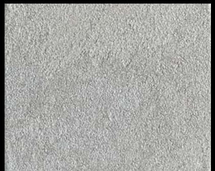
Toner № 524 - 4cc