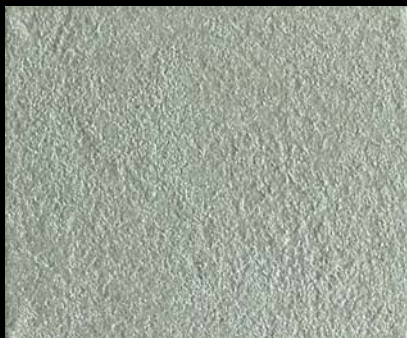
Toner № 514 - 0,5cc