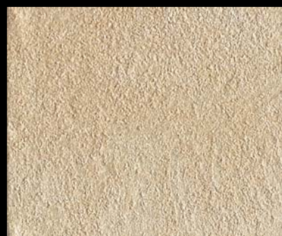
Toner № 518 - 4cc