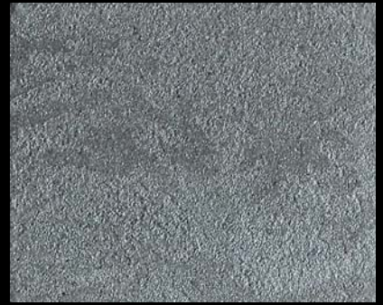
Toner № 501 - 4cc