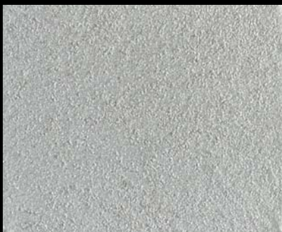
Toner № 524 - 0,5cc