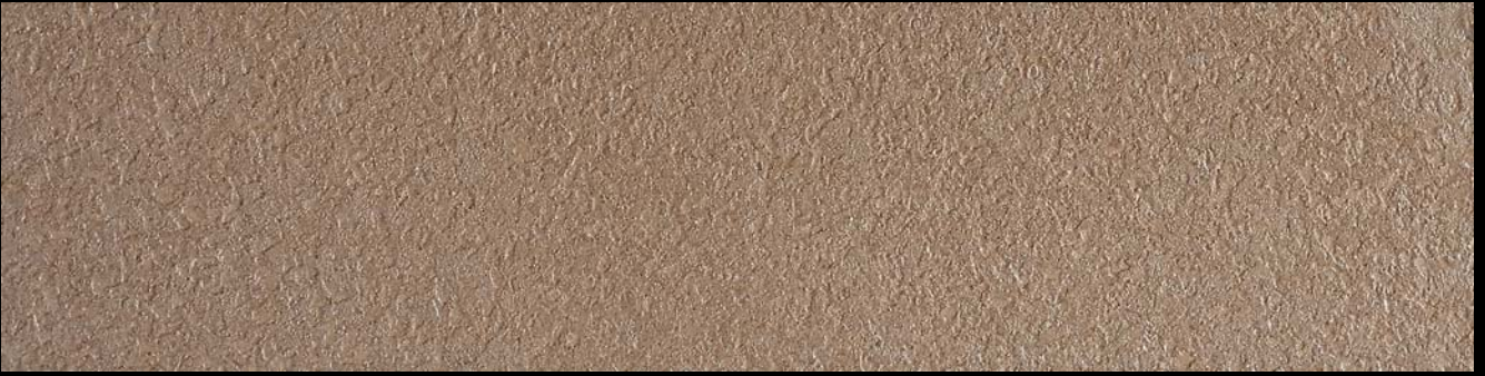
Enigma Silver + Toner № 503-12cc + № 519-8cc