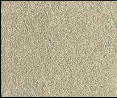
Toner № 506 - 0,5cc