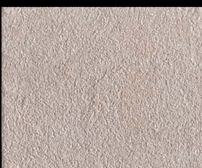
Toner № 520 - 1cc