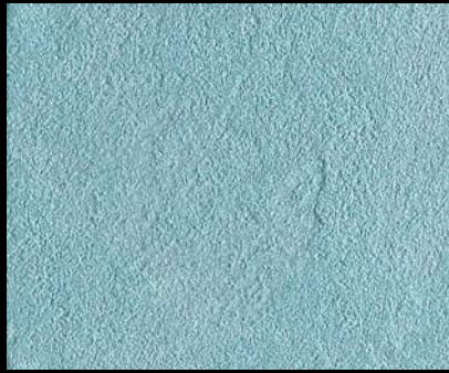
Toner № 509 - 1cc