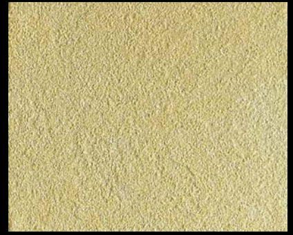
Toner № 506 - 4cc