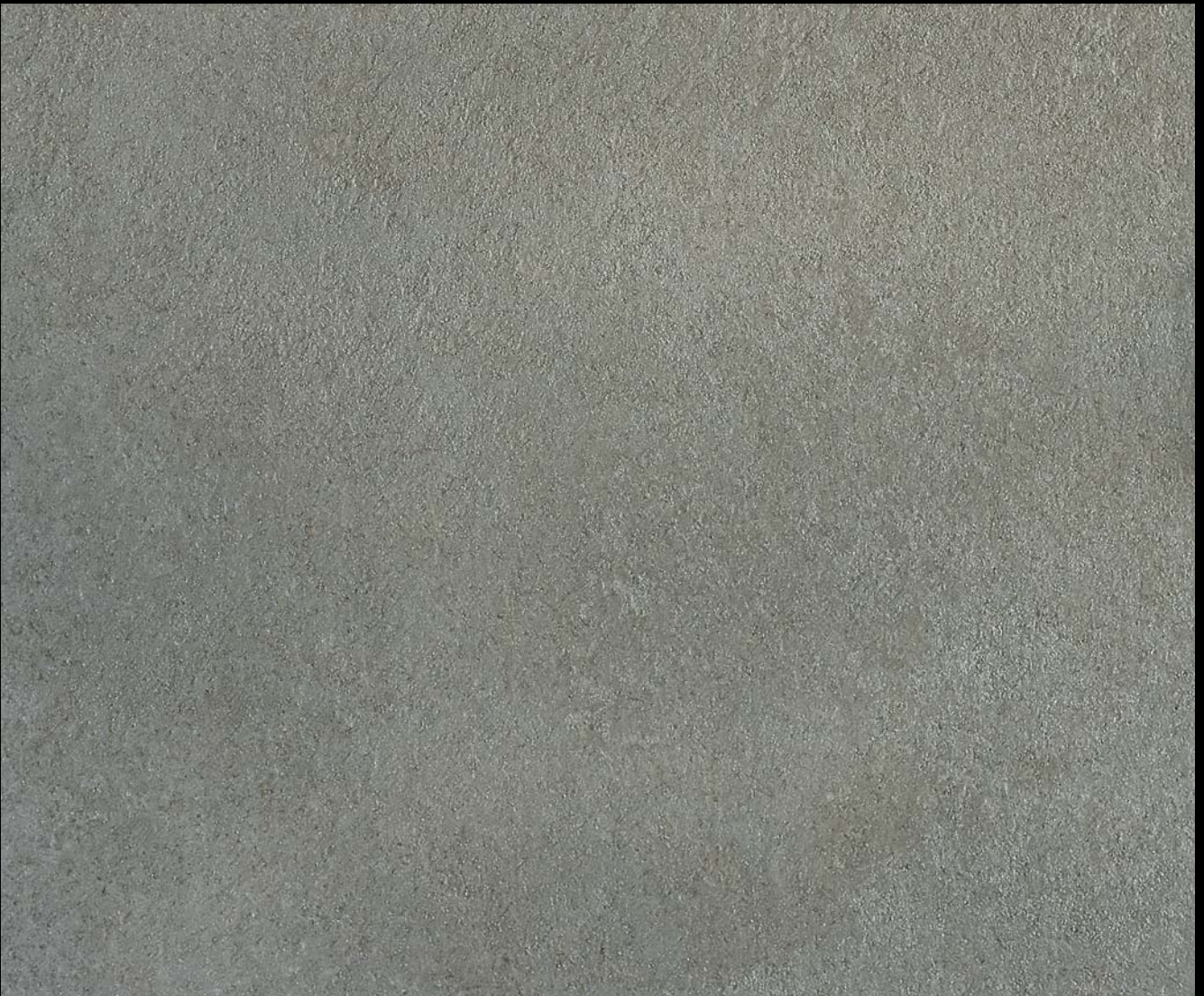
Enigma Silver + Toner № 522-8cc + № 512-2cc