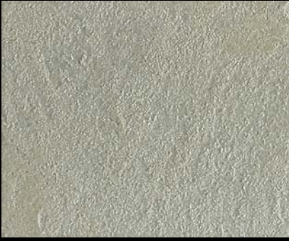
Toner № 546 - 0,5cc