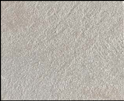
Toner № 522 - 0,5cc