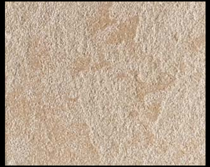
Toner № 521 - 4cc