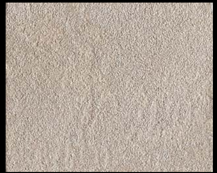
Toner № 503 - 4cc