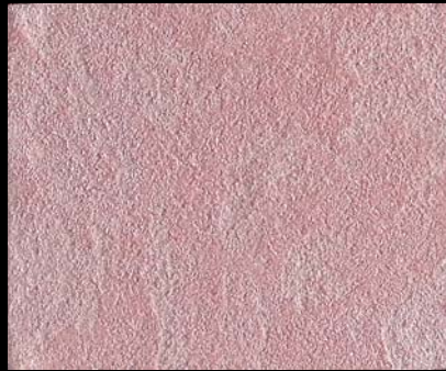
Toner № 510 - 1cc