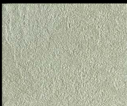
Toner № 515 - 1cc