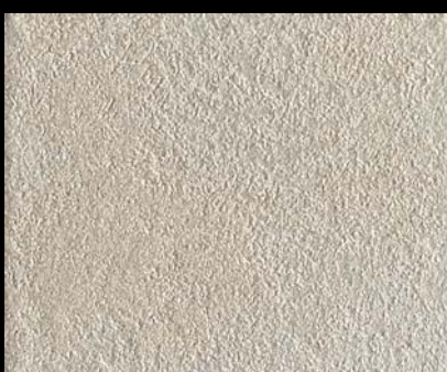
Toner № 519 - 1cc