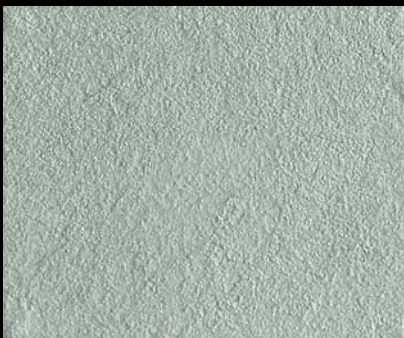
Toner № 512 - 0,5cc