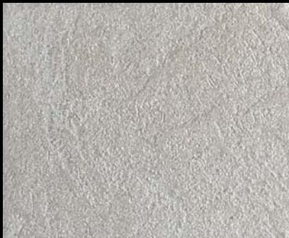
Toner № 523 - 0,5cc