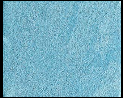
Toner № 509 - 4cc