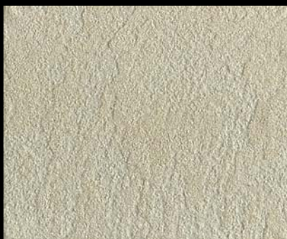
Toner № 505 - 1cc