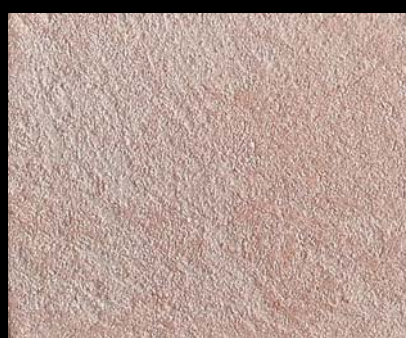
Toner № 520 - 4cc