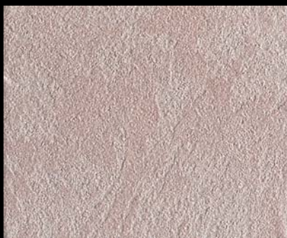
Toner № 504 - 1cc