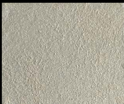
Toner № 518 - 0,5cc