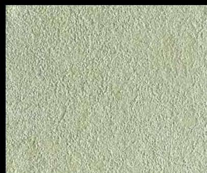
Toner № 515 - 4cc