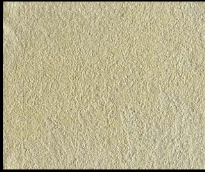
Toner № 506 - 1cc