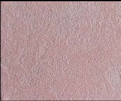
Toner № 510 - 0,5cc