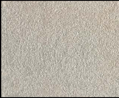
Toner № 521 - 0,5cc