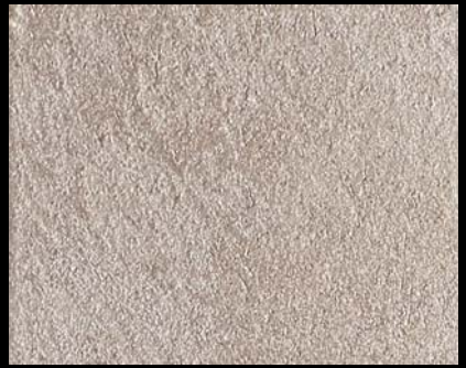
Toner № 522 - 4cc