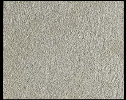
Toner № 502 - 4cc