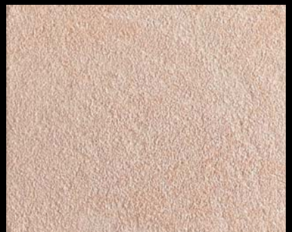
Toner № 542 - 4cc