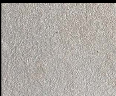
Toner № 520 - 0,5cc