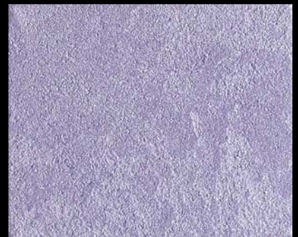
Toner № 511 - 4cc