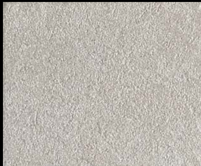
Toner № 523 - 1cc