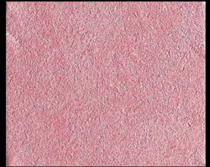
Toner № 510 - 4cc