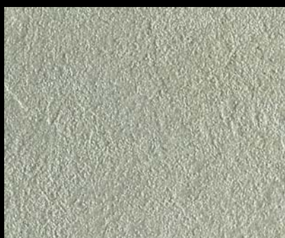
Toner № 515 - 0,5cc