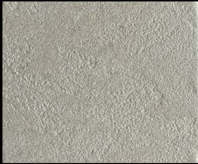
Toner № 502 - 0,5cc