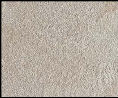
Toner № 503 - 1cc