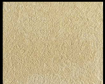
Toner № 505 - 4cc