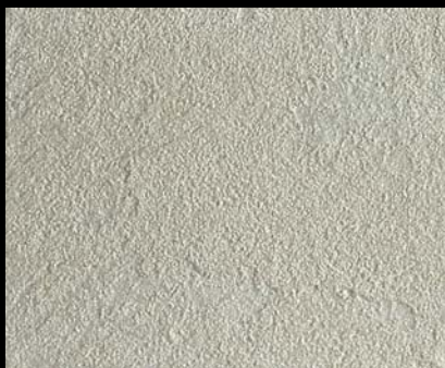
Toner № 505 - 0,5cc