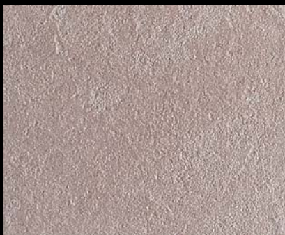
Toner № 504 - 0,5cc