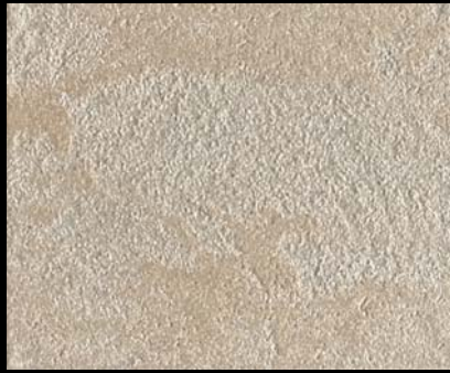
Toner № 521 - 1cc