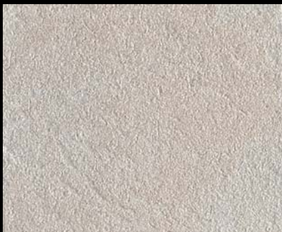
Toner № 542 - 0,5cc