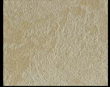
Toner № 546 - 4cc