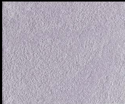
Toner № 511 - 1cc