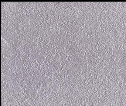
Toner № 511 - 0,5cc