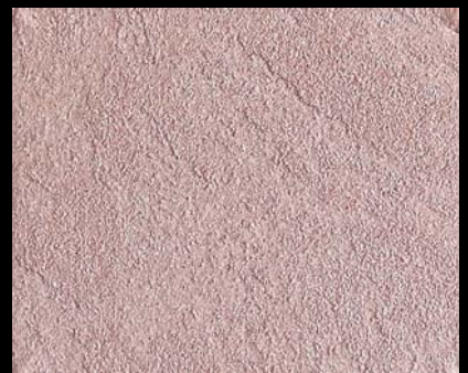
Toner № 504 - 4cc