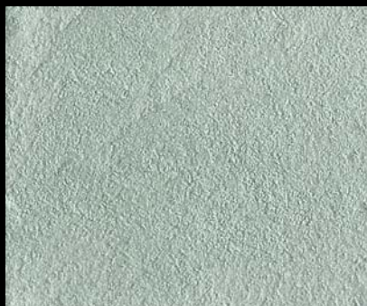
Toner № 512 - 1cc