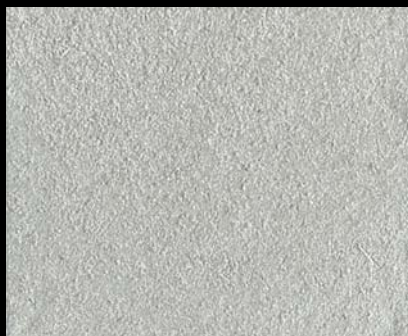
Toner № 524 - 1cc