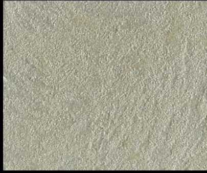
Toner № 546 - 1cc