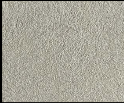
Toner № 502 - 1cc